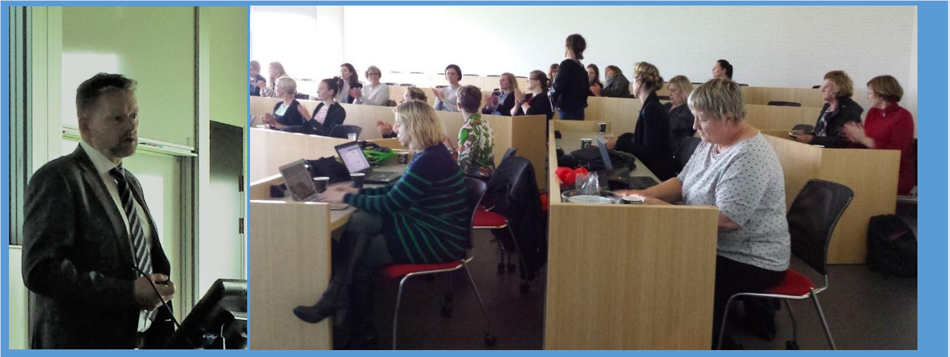
Þorsteinn Víglundsson félags- og jafnréttismálaráðherra ávarpar aðalfund SKVÍS 30. maí 2017.